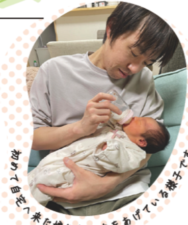
初めての育児、来た娘にミルクをあげている様子です

私は育児に専念する時間が欲しいと考え、出生時育児休暇(いわゆる産後パパ育休)を取得しました。育児・介護休業法改正に伴い、機構においても新たに出生時育児休暇(有給)の制度が制定された直後でしたので、早速利用しました。私はこの休暇を28日間フルに取得し、その他の育児等に係る各種制度および年休も活用し、計2カ月間の休暇をいただきました。休暇取得については予め上司へ相談し、自分が担当している業務についてリストアップし、分担者も決めました。周囲の皆様がとても協力的だったおかげで予定通りに休暇を取得でき、休暇中の業務に関しても滞りなくフォローしていただきました。私はこの休暇を活用することで、妻と一緒に育児を開始することができ、産後すぐの育児の大変さ・楽しさを共有できました。おかげで今でも夫婦で協力し、育児ができています。もし休暇取得を迷っている方がいるなら、是非取得することをお勧めします。休暇取得には周囲の理解も欠かせません。出生時育児休暇を含め、育児に関する休暇の取得に多くの方が理解・協力し、希望者が取得しやすい環境になると、とても働きやすい職場になると思います。