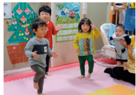
国立天文台保育ルーム「星の子」

アクションプランの実行を通して、自然科学研究機構では、さまざまな側面から男女共同参画を推進しています。