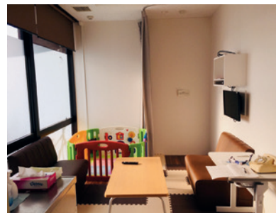
基礎生物学研究所 「多目的室(子供帯同可能部屋)」

◎基礎生物学研究所「多目的室(子供帯同可能部屋)」 個別のディスカッションや昼食の場に加えて、夜間や休日など、子供連れで研究所に来る必要がある際にも利用できるスペース。